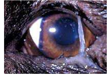
Entropion met slijmvorming

Een oogaandoening waarbij de rand van het ooglid naar binnen krult, meestal het onderste ooglid en de wimperhaartjes tegen de oogbol wrijven. Deze raakt daardoor geïrriteerd en kan gaan ontsteken. Er zijn 3 verschillende gradaties, ingedeeld naar de uitgebreidheid van het omkrullen: hooggradig (180°), middelgradig (90°) en laaggradig (45°). De aandoening kan erg pijnlijk zijn.